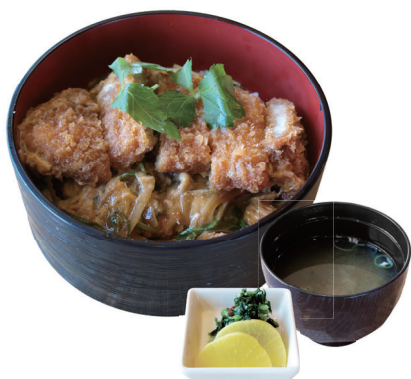
熊本県産豚 ロースカツ丼

コーヒー(ホット/アイス)・紅茶(ホット/アイス)・カフェラテ(ホット/アイス) コーラ・オレンジジュース・アップルジュース・マンゴージュース からお選びください