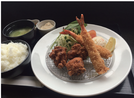
鶏唐揚げと海老フライ定食