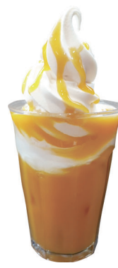
マンゴー ソフトフロート Mango Float