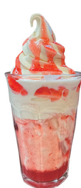
ベリー ソフトフロート Berry Float