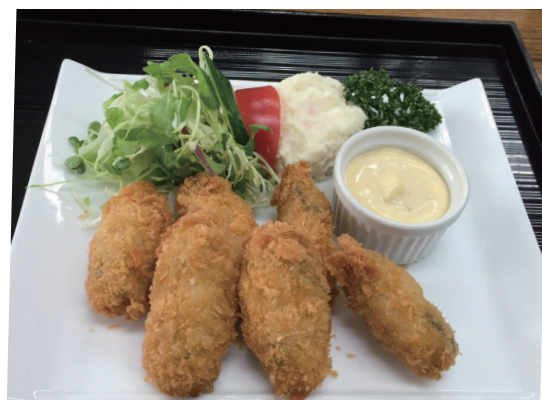
広島産カキフライ定食