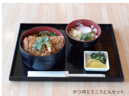
かつ丼とミニうどんセット