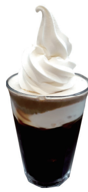
コーヒー ソフトフロート Coffee Float