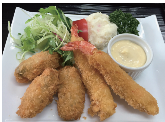
海老&広島産カキフライ定食